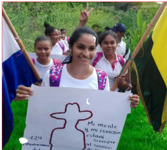
Imagen 1 Actividad educativa en el campo